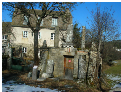
Petit Musée de l'Abbé Vassal