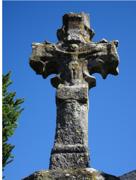
Croix - La Fage St-Julien