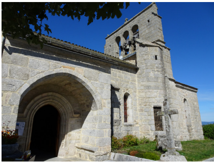
Église de La Fage