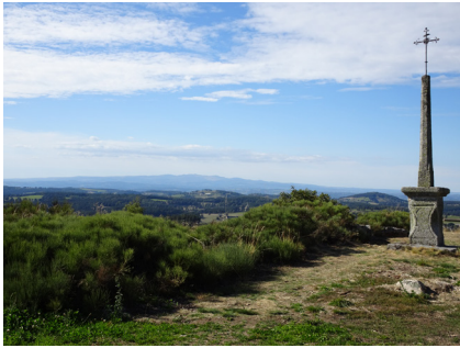
Les Monts du Cantal depuis Termes