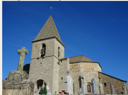
Église de Termes

tion qui décrit le panorama : d'ouest en est, on peut voir le Mont Alhérac, le massif du Cantal, plus loin les massifs du Cézaillier et du Sancy et la chaîne de la Margeride. Sous l'Ancien régime, le village de Berc dépendait de Termes.