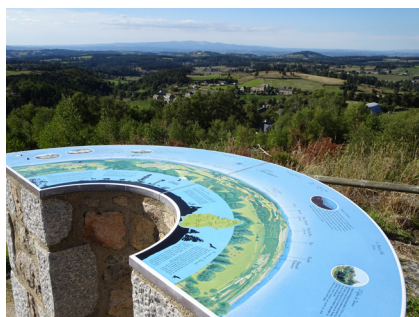
Table d'orientation de Termes