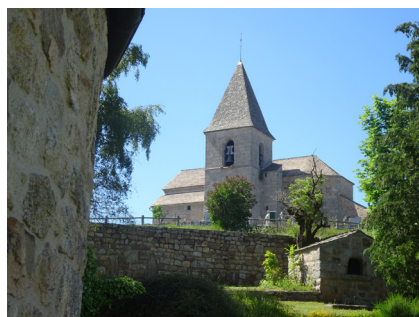
Église de Termes