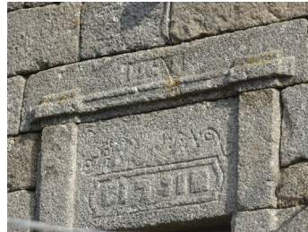
Linteau de porte