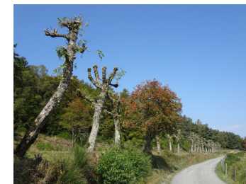
La taille des frênes