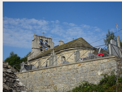
Saint-Laurent : l'église

naissance. À l'extérieur, une corniche entoure les parois de la nef et de l'abside. Des contreforts cantonnent la nef à l'extrémité occidentale et au niveau de la retombée des doubleaux. Une sacristie moderne dépare la belle masse de l'abside sur laquelle on l'a greffée." Saint-Laurent possède aussi un four à pain, une belle croix sculptée et une maison datant de 1791.