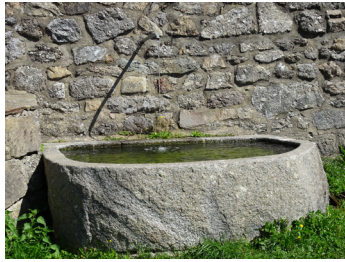
Veyrès : la fontaine