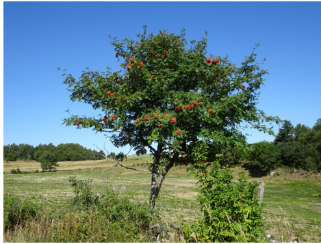
Sorbier des oiseleurs