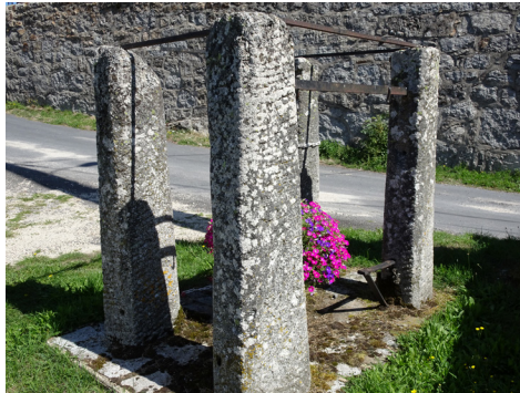
Veyrès : le métier à ferrer