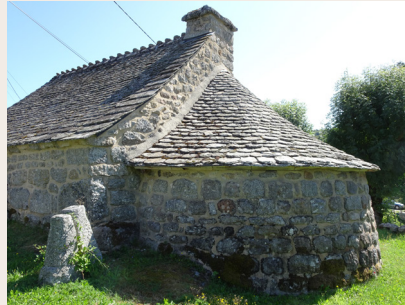
Veyrès : le four

du four banal, du métier pour ferrer les boeufs ("lou ferradou" en occitan) et d'une fontaine creusée dans un seul bloc de granite.