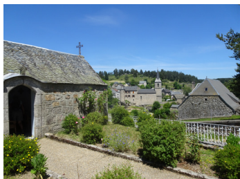
Saint-Juéry : la chapellette