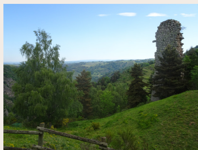
Vestiges de la tour d'Arzenc d'Apcher

le portail et le clocher mur. Le folklore d'Arzenc d'Apcher est riche de deux légendes : "Lou roc de la Brouziduro", rocher hanté par le souvenir d'une jeune fille qui s'y tua pour échapper au fils du châtelain et "Lou Pas del Nobî" qui désigne un passage périlleux sur le Bès où un jeune marié se noya.