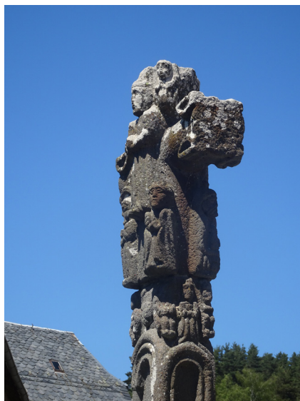
La croix de Saint-Juéry