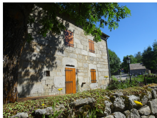
Bécus, ferme bâtie en 1818