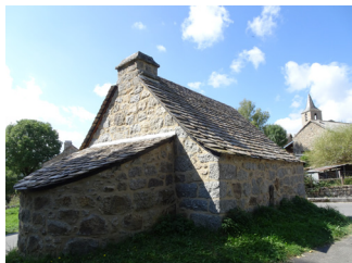
Bécus, le four banal