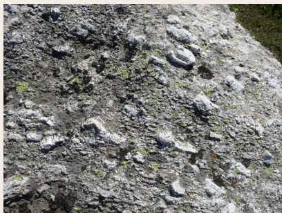
Granite "dents de cheval"

la chaîne de la Margeride, au nord-est du département de la Lozère, mais c'est aussi le socle de l'Aubrac où il est occulté, à l'ouest, par des coulées volcaniques beaucoup plus récentes (environ 7 Millions d'années). Dans le paysage, lorsque le granite est dégagé par l'érosion, il se présente soit sous la forme de chaos (empilements impressionnants de très gros blocs plus ou moins arrondis) soit, lorsqu'il a été abandonné par la fonte récente des glaciers, sous forme de blocs isolés (les blocs erratiques du plateau central de l'Aubrac). Le granite de la Margeride est parfois recoupé par des filons, comme celui de quartz de Fenestre qui fut utilisé dans l'aciérie de Saint-Chély-d'Apcher pour fabriquer des aciers au silicium.