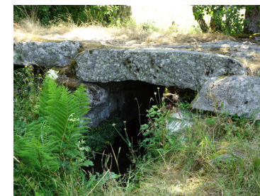
Feu le pont de granite