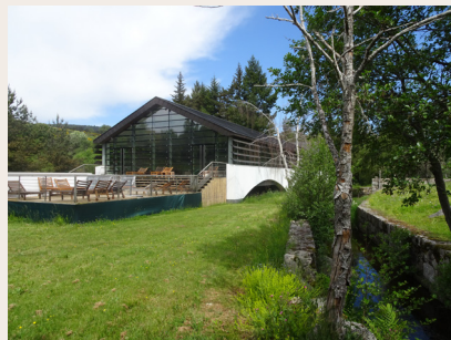
Ses thermes de La Chaldette

Ses eaux sont recommandées pour le traitement des voies respiratoires et celui des affections digestives et métaboliques. Ce centre de remise en forme - espace de cure, situé sur le GR® de Pays Tour des Monts d'Aubrac , possède une résidence thermale et des hébergements pour les randonneurs.