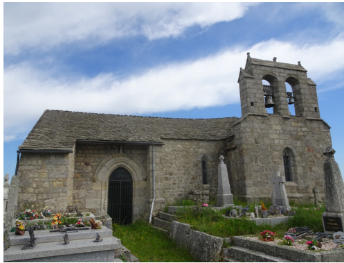
Église d'Arzenc d'Apcher