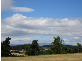
Au loin, les Monts du Cantal