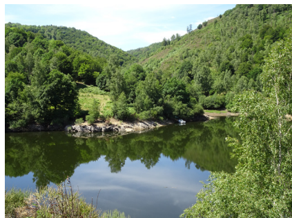
Les gorges du Bès