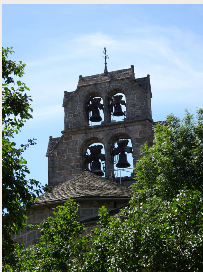
Le clocher d'Albaret

Commune la plus septentrionale de la Communauté de Communes des Hautes Terres de l'Aubrac, Albaret-le-Comtal n'est séparé du département du Cantal que par les gorges du Bès. Son nom viendrait de l'occitan "albar" qui signifie soit aubier , la zone tendre et blanchâtre entre l'écorce et le cœur de l'arbre soit tremble (ou peuplier blanc ). Le Bès s'élargit car il marque depuis 1960 l'extrémité méridionale de la retenue du barrage hydroélectrique de Grandval. Au Moyen-Âge, Albaret était un prieuré dépendant de l'évêque de Mende. Son église avec son clocher-mur à quatre baies daterait du XIII ème siècle : en effet, la tradition rapporte qu'au XII ème s. la paroisse était située à La Fraissinette. Certains des personnages sculptés sur des modillons sous la corniche de l'abside sont curieux. Deux croix de fer forgé, l'une dans le cimetière sous l'église, l'autre devant