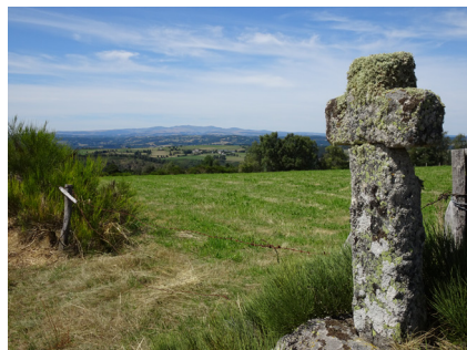
Au loin, le Cantal