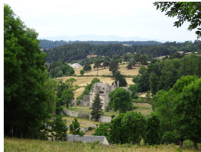
Ch teau de Brion et Massif du Cantal