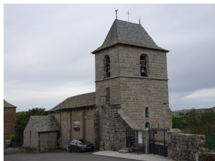
Église de Recoules d'Aubrac