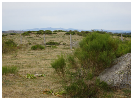
Au loin, les Monts du Cantal