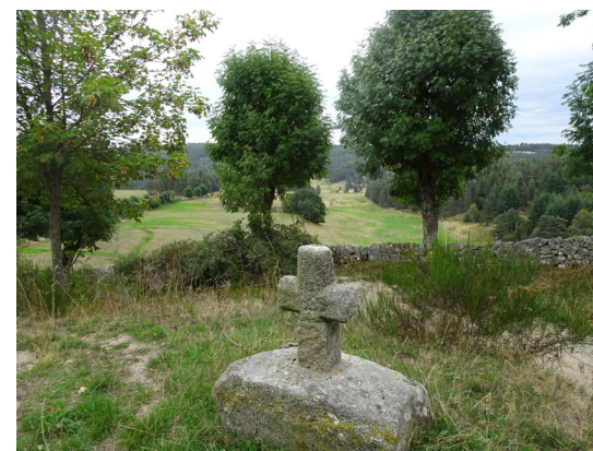
Croix à La Bessière