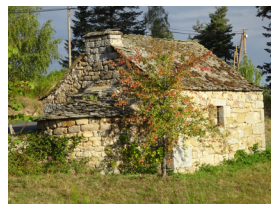
Arcomie : le four