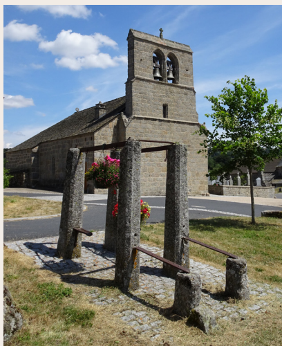
Brion : Église et ferradou

patte est repliée et attachée. Le paysan peut alors travailler en toute tranquillité pour fixer le nouveau fer sur la sole de la bête ce qui permet de protéger la corne des onglons des pieds des bovins. Cette structure était capable de maintenir en place des bêtes pesant jusqu'à une tonne.