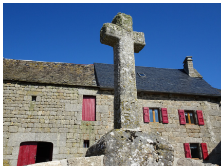
Grand Viala le Vieux