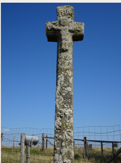
Croix à Malbouzon

un clocher mur à 3 baies romanes surmontées d'un oculus et d'un clocheton. L'église possède une cuve baptismale datant de 1776. De nombreuses croix de granite jalonnent les chemins de Malbouzon