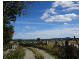
Au loin, les Monts du Cantal