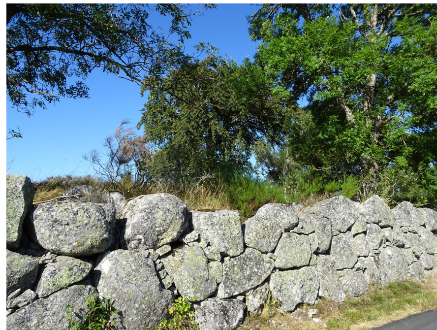
Mur de granite