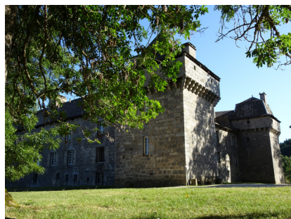
Le Château de La Baume