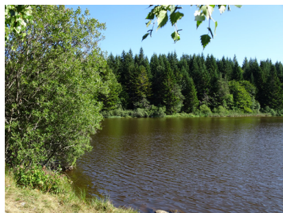
L'étang de La Baume