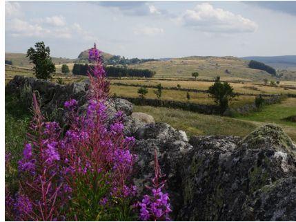
Au loin, la Motte de Marchastel