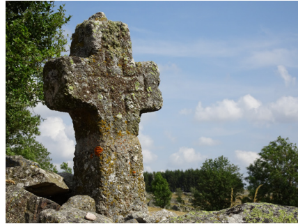
Croix à Rieurtort d'Aubrac