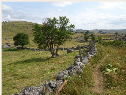
La draille de Marchastel

passage des Anglais durant la Guerre de Cent Ans, cf. Buckingham), au pied du puech, a fourni des pierres pour les clôtures et les maisons et fut la dernière en activité.