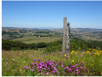
Le Cantal depuis la Sentinelle