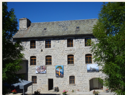
Nasbinals : la Maison Charrier

Il y sera arrêté par des patriotes de l'Aveyron, condamné à mort le 16 juillet 1793 et exécuté le lendemain à Rodez. Son épouse, enceinte, sera acquittée.