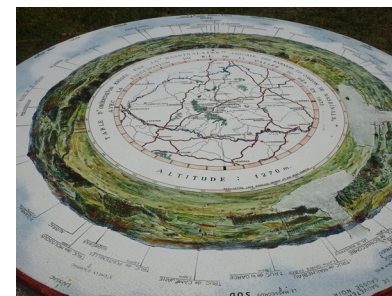
La table d'orientation