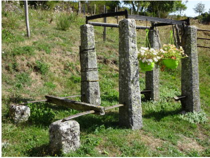
Le Vialas : métier à ferrer les boeufs