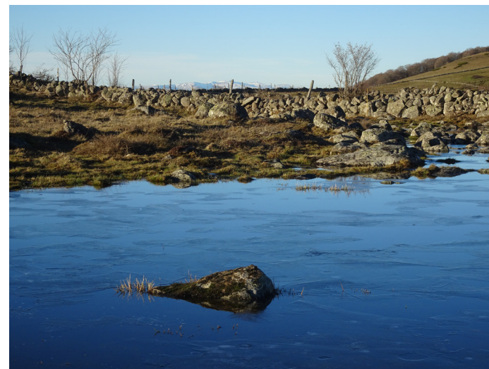
Au fond les Monts du Cantal