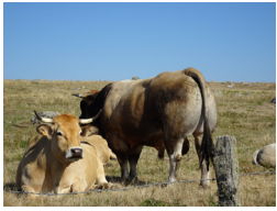
Vache et taureau Aubrac