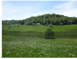
Narcisses et grange