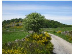
Sur le chemin de Saint-