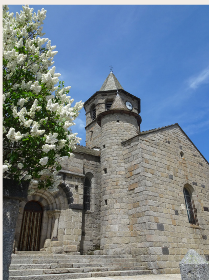
Église de Nasbinals

ronde, à l'angle de la nef et du transept abrite un escalier à vis. Enfin, ne manquez pas d'admirer un Christ du XVI ème s. et un retable en bois doré du XVII ème siècle.