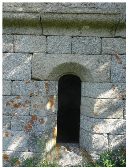
La chapelle du Cher