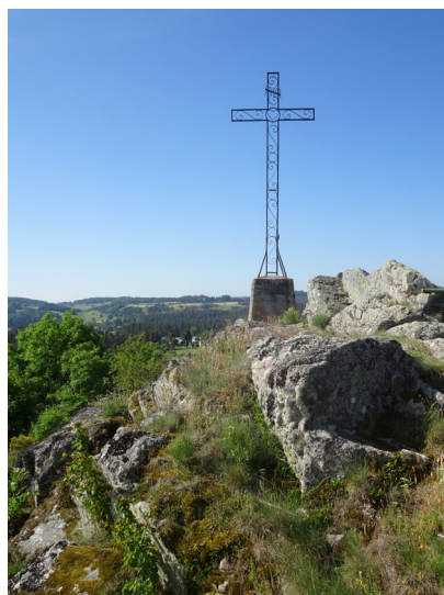
Le Rocher du Cher