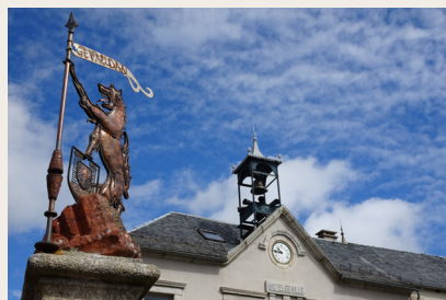
Aumont-Aubrac : la bête du Gévaudan

attaques, les habitants montrèrent un grand courage, mettant "le monstre" en fuite à plusieurs reprises. Cette Bête qui "mangeait le monde" sera finalement abattue en juin 1767, dans le Pays de Saugues (Haute-Loire).