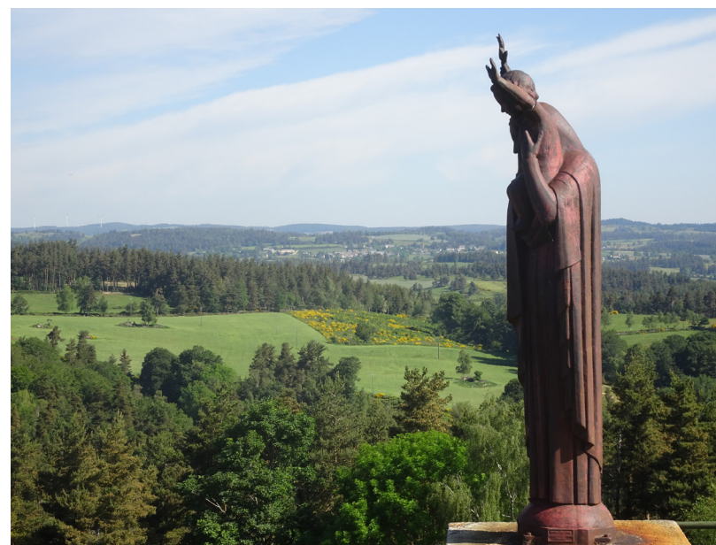
Vue du rocher du Cher