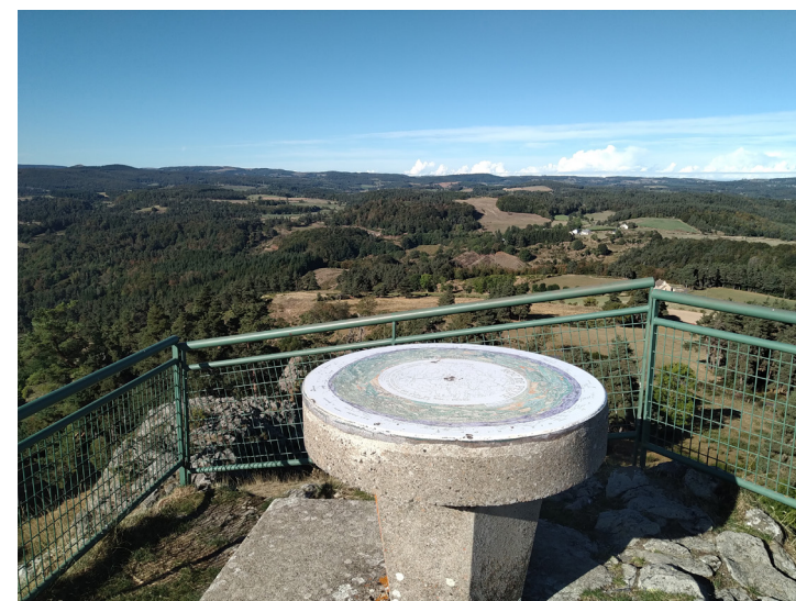
Sommet du Roc de Peyre