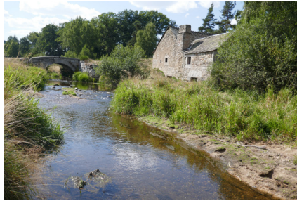
Moulin de Belle Vue le Pont