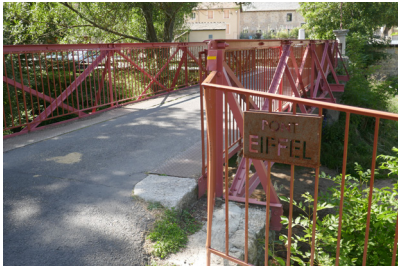
Pont Eiffel Javols