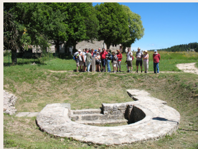
Javols : les thermes gallo-romains

Javols, axé sur la vie quotidienne et les principes archéologiques, s'appuie sur deux pièces majeures, une borne miliaire et une statue grandeur nature du dieu forestier gallo-romain Silvain-Sucellus. Des visites utilisant des casques de réalité virtuelle sont proposées.