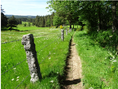
Clôture typique de la Margeride