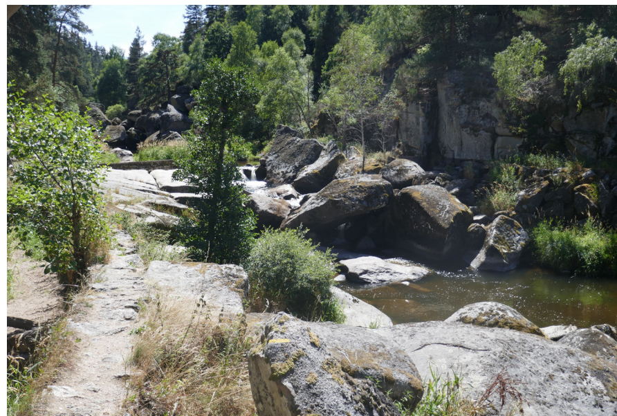
Chaos du Baou de Lestival