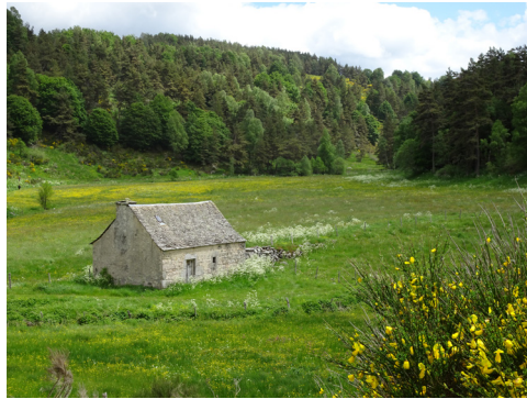
Moulin de Graniboules