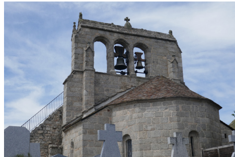
Église du Fau-de-Peyre