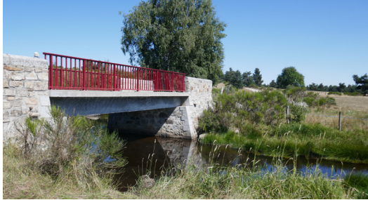
L'Aubrac au printemps