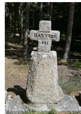
Croix de Bastide