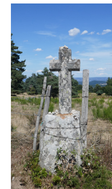
Croix de Conord