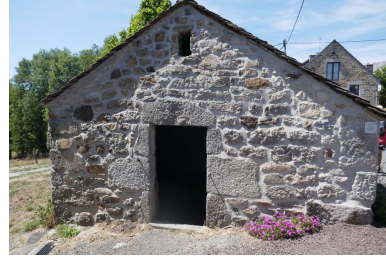
Four banal La Chaze