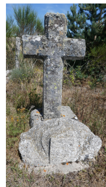
Croix La Chaze