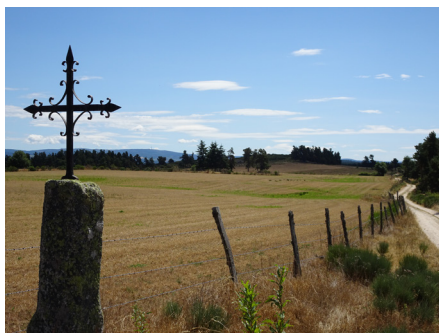
Au loin, les Monts d'Aubrac