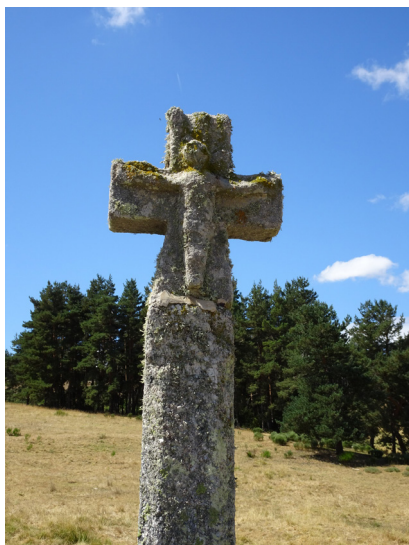
Croix en granite