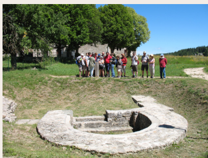
Javols : les thermes gallo-romains

Javols, axé sur la vie quotidienne et les principes archéologiques, s'appuie sur deux pièces majeures, une borne miliaire et une statue grandeur nature du dieu forestier gallo-romain Silvain-Sucellus. Des visites utilisant des casques de réalité virtuelle sont proposées.